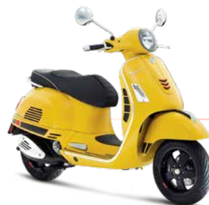
Gelb Gelosia 974/A