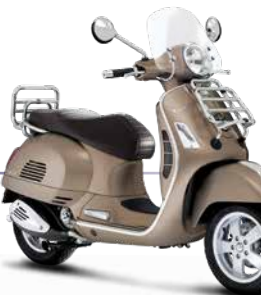
Braun Creta Senese 129/A