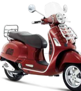
Rot Vignola 880/A