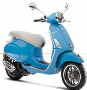
Blau 50° 291/A (Abbildung: 125 ccm-Version)