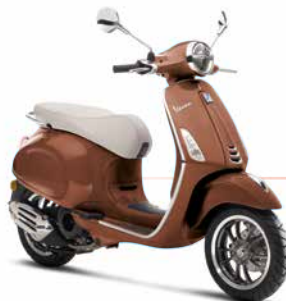
Braun matt 50° 139/A (Abbildung: 125 ccm-Version)