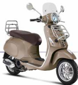
Braun Creta Senese 129/A