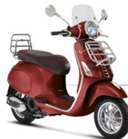
Rot Vignola 880/A