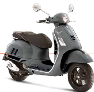
Grau Titanio 707/C