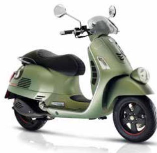
Grün matt 344/A